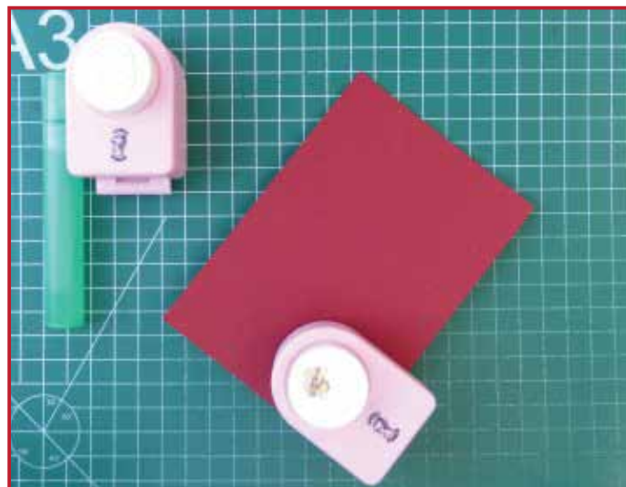
2. Pons het ovaaltje uit