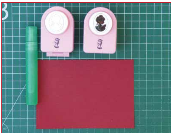
1. Benodigdheden : Cameo punch, karton, een spuitflesje met water erin