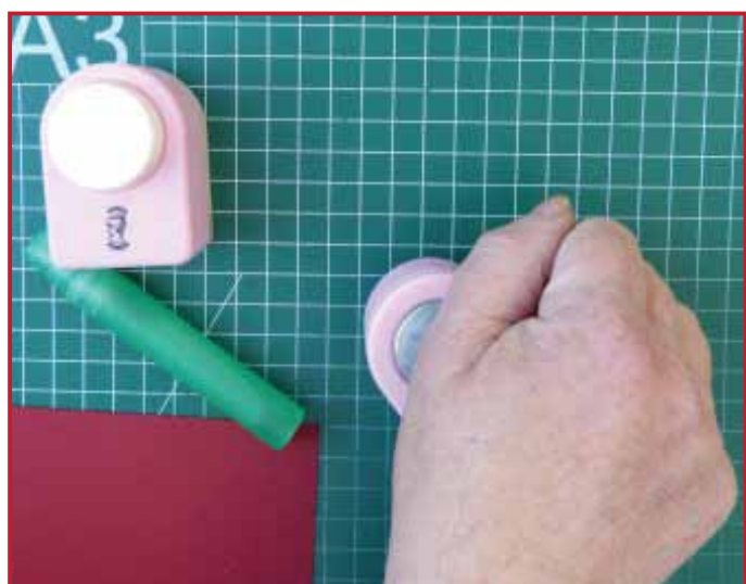
5. Druk stevig op de pons met draaiende beweging en de knop naar de onderzijde.