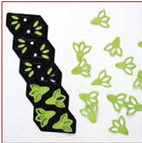
4. Het resultaat.