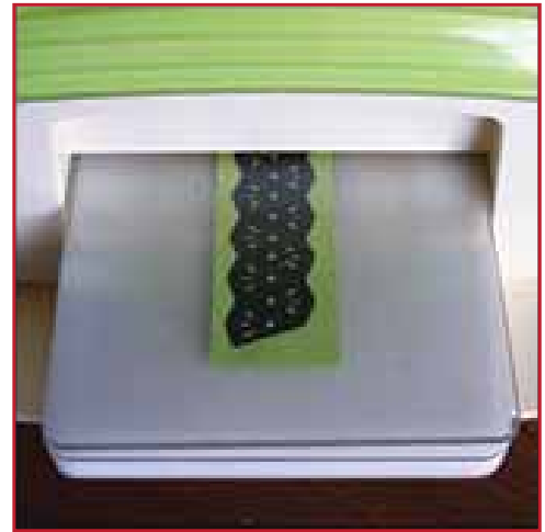
3. Stans ook de kleine figuurtjes.