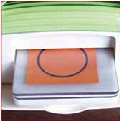
1. Gebruik de stansmachine om de Die te snijden.