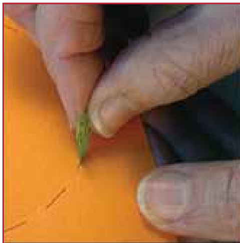
5. Steek twee figuurtjes door het geleufje.