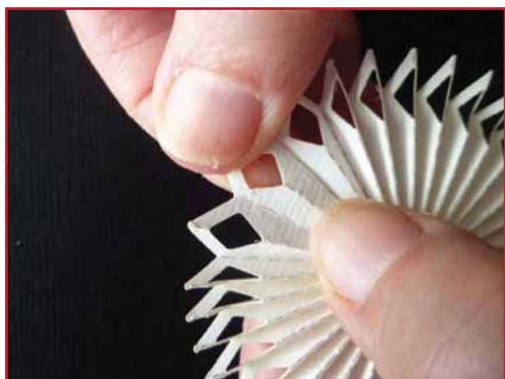
5. Goed aandrukken en opnieuw vouwen!