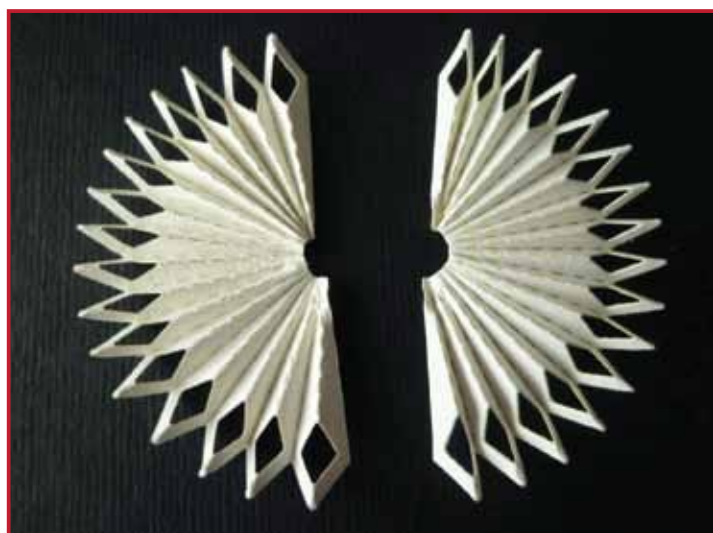
3. Vouw op de kartellijn de vorm als een harmonica.