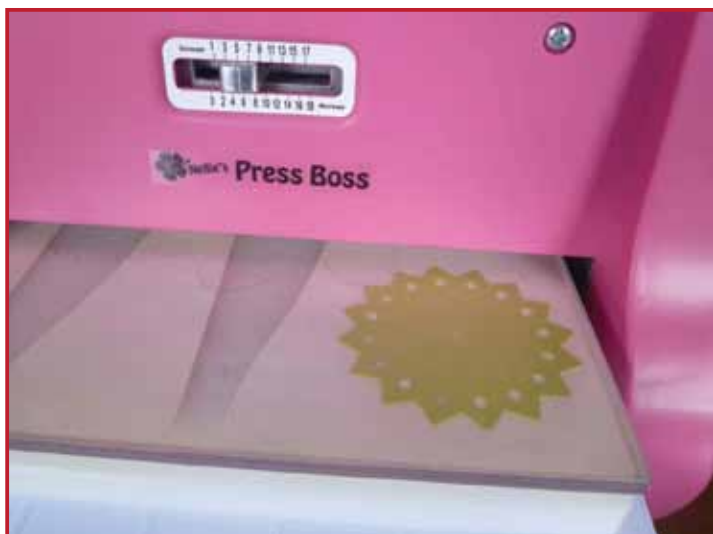
1. Snijd de Folding Die uit met je stansmachine.