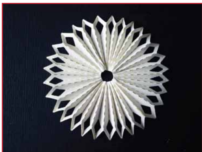
6. Het eindresultaat