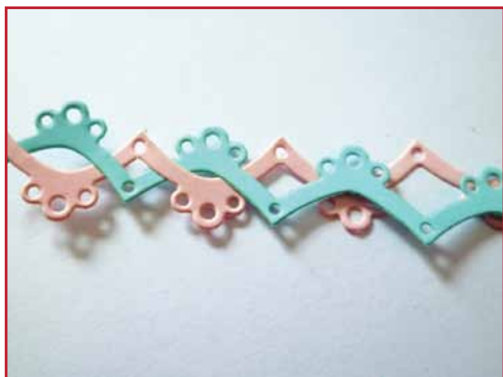
3. Doe dit helamaal tot het einde.