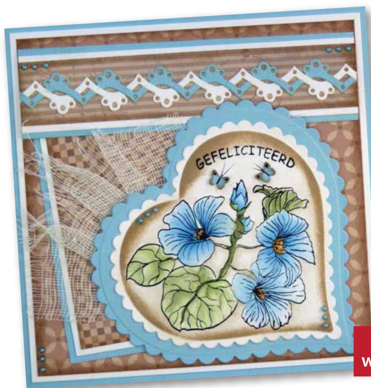
5. Maak hier een kaart mee.

WEETJE: Je kunt de rand verlengen, je kunt deze zo lang maken als je wilt. Verleg de Die op je karton.