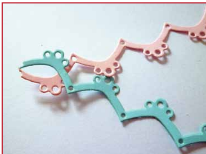
2. Vlecht de strookjes in elkaar.