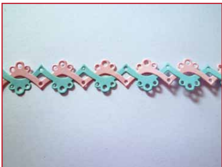
4. Het resultaat!