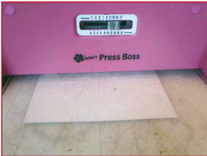
1. Embos een stuk aquarel papier.