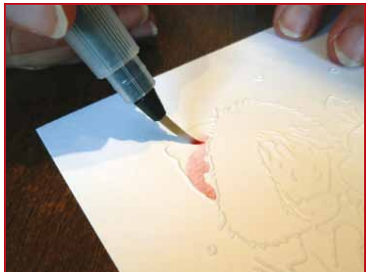
4. Kleur de ge-emboste tekening in naar wens. Doe dit met een draaiende beweging en begin daar waar de kleur het donkerst moet zijn.