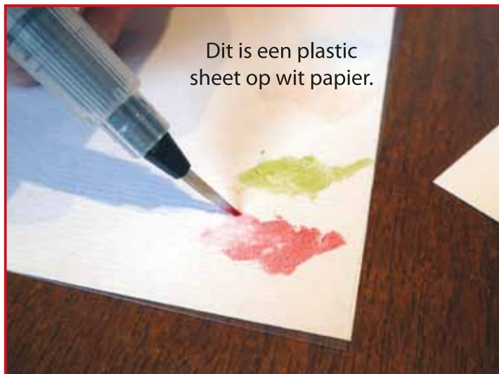
3. Veeg met de Memento marker op de transparante sheet en pak hier wat van op met je waterpenseel.