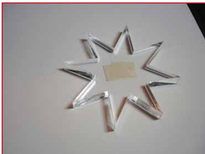
2. Plak de stervorm met makkelijk verwijderbare tape of een buddy vast.