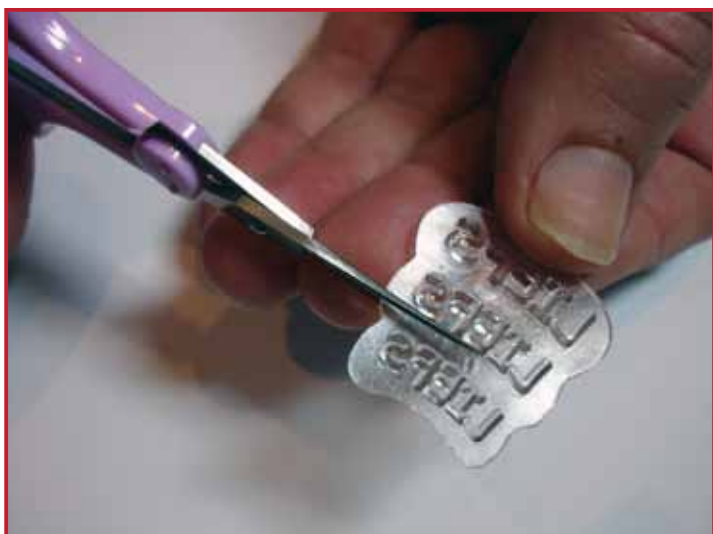
1. Knip de Clear stamps los.