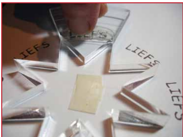
4. Stempel de tekst door de precision blok in de uitsparing te zetten.