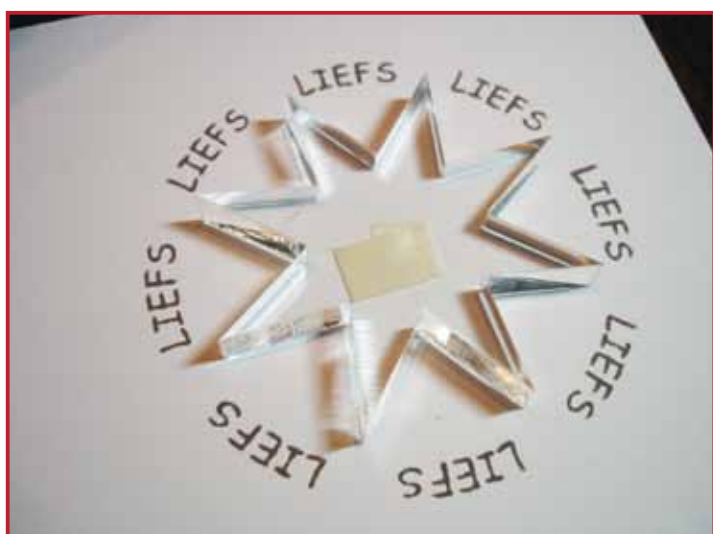
5. Stempel zo helemaal rond.