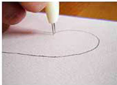
2. PRIK MET DE SWIRLMAKER 2 GAATJES OP DE POTLOODLIJN