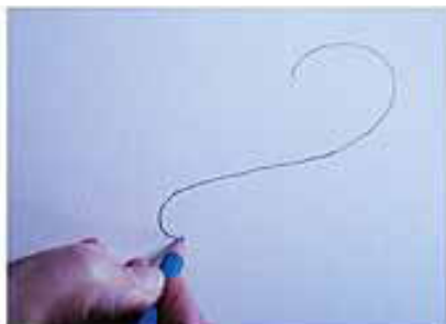
1. TEKEN EEN SWIRL OP JE KARTON