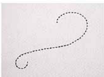
5. HET RESULTAAT