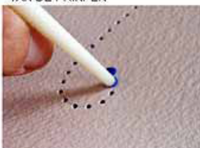
9. STEEK DE MAGIC DOT DOOR HET GAATJE. DOE DIT IN DE LUCHT ZODAT JE DE DOT NIET SCHEEF DRUKT. DRAAI DAARNA JE PRIKPEN WEG