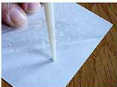
7. DOE EEN GLUE DOT OP DE BOVENKANT VAN DE PRIKPEN