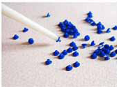
8. PAK HIERMEE DE MAGIC DOT OP