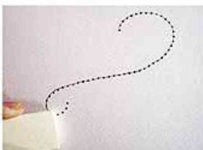
6. GUM DE POTLOODLIJN WEG