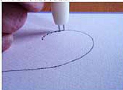
4. DOE DIT BIJ DE HELE SWIRL, PRIK TELKENS MET DE EERSTE NAALD PRECIES IN HET LAATSTE GAATJE.