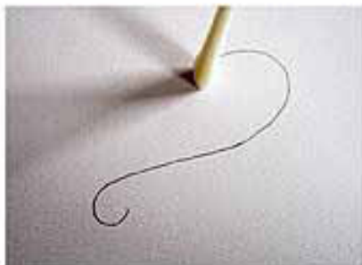
3. STEEK DE NAALD HELEMAAL IN HET KARTON, NIET ALLEEN DE PUNT