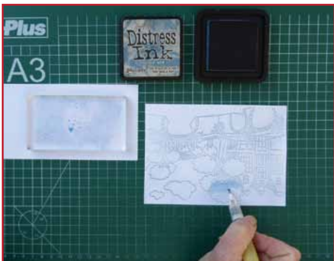
5. Neem wat donkere inkt op met je waterpen en vul de vlakjes in met draaiende beweging van links naar rechts.