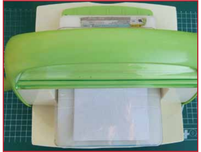
2. Embos de witte kaart met behulp van de Picture embossing folder