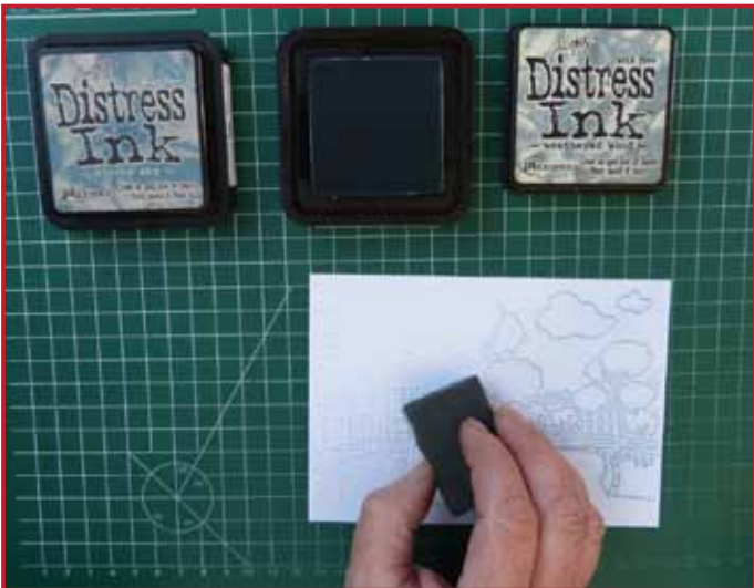
3. Beinkt de kaart helemaal met de lichtste kleur inkt en een sponsje