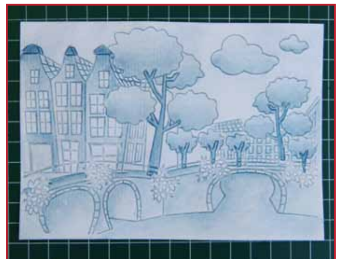
6. Het eindresultaat

Bekijk filmpjes op: www.nellies-choice.com/index.php/nl/filmpjes