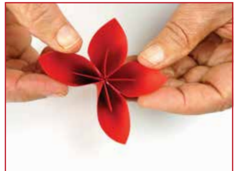
Plak zo de bloem verder in elkaar.