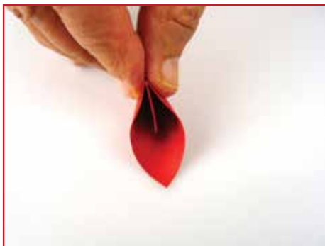
Laat dit goed drogen.