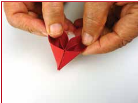
Plak de twee vormen aan elkaar.