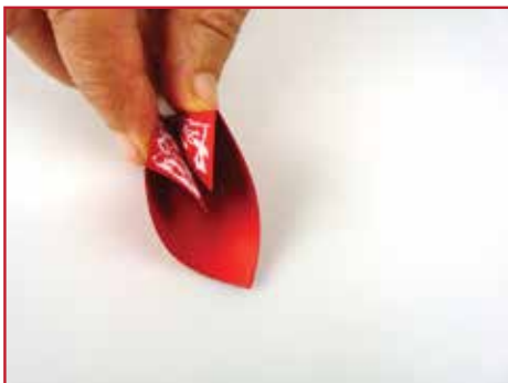
Plak de delen aan elkaar.