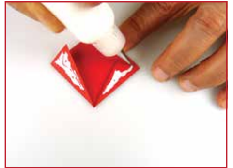
Breng Tacky Glue aan op de gevouwen delen.